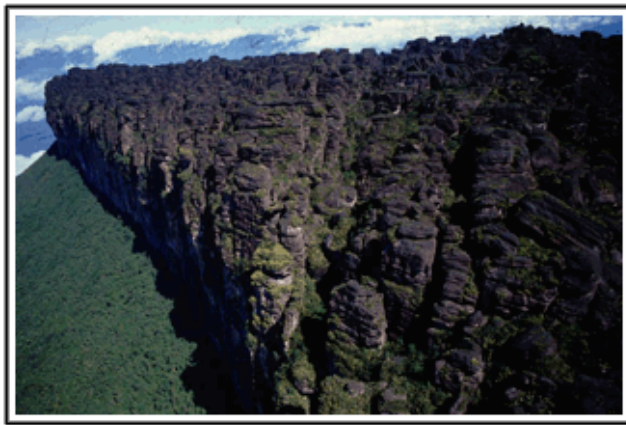
Amanecer sobre el Aparamán Tepuy. Estado Bolívar 1987

En su oficina, entre papeles y libros, se pueden observar varios afiches y una cartelera llena de fotos. En ella -como si fuera un cuadro cronológico-, se aprecian caras desconocidas y paisajes nunca antes vistos, que presumiblemente describen diversos momentos en la vida de Fabian Michelangeli. Sobre su escritorio se encuentra la versión en inglés de su libro "Diálogo con lo Natural" (Dialogue With Nature, 1992), quizás una de las publicaciones más significativas dentro de la trayectoria de este investigador, y en la que describe fotográficamente con detalle, la naturaleza de lugares anónimos, entremezclados unos con otros.