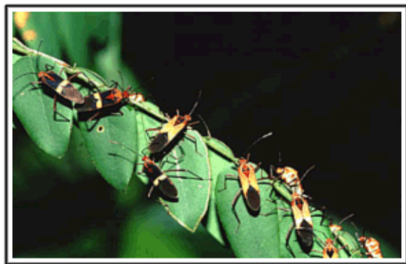
Hemípteros. Rancho Grande. Parque Nacional Henri Pittier, estado Aragua, 1995.

En las instalaciones del edificio de Biofísica y Bioquímica del Instituto Venezolano de Investigaciones Científicas (IVIC) labora, desde hace más de treinta años, un hombre que ha concentrado gran parte de su vida al estudio de la fisiología y fisiopatología de procesos digestivos en los seres vivos. Se trata de Fabián Michelangeli, quien no conforme con entregar su tiempo a la ciencia, se ha dedicado por años a capturar, con su lente fotográfico, las maravillas que encierra la naturaleza.