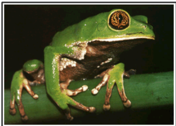
Rana ( Phyllomedusa trinitatis ).

- ¿Particularmente, a qué se dedica en el campo de la investigación?