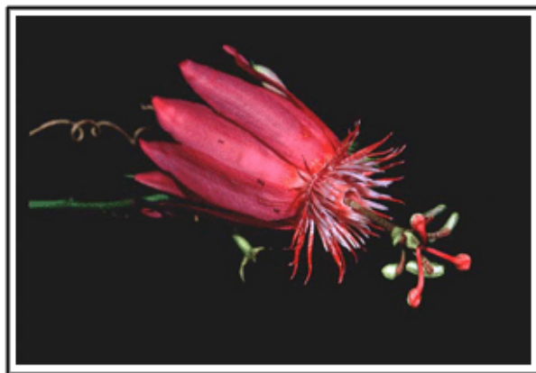
Flor de parchita silvestre ( Passiflora coccinea ). Yutajé, estado Amazonas, 1996.

- ¿Qué progresos cree usted que se han dado dentro de este campo?