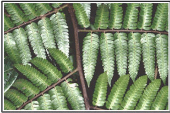
Hoja de helecho arborescente. Pico Codazzi, estado Aragua, 1998.

muy visual. Tomo una foto en el microscopio como si fuera un cuadro, intento mostrar todo lo que hay que enseñar desde el punto de vista científico, pero además también necesito que sea bella, que diga algo.