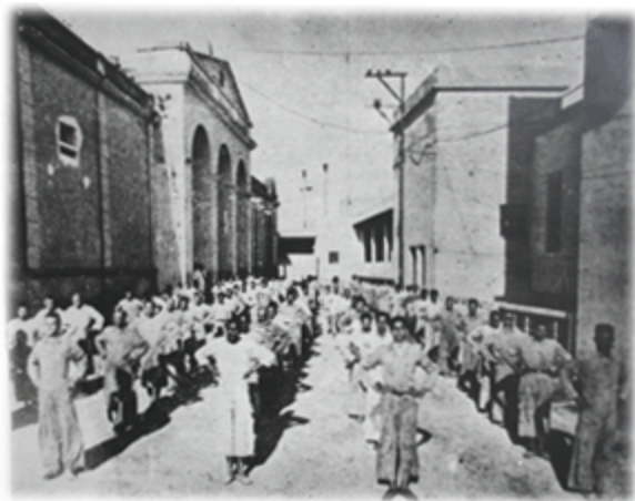
Pacientes del Hospital Psiquiátrico de Caracas haciendo ejercicio.