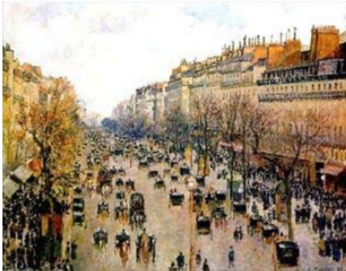
Balada a Monmartre 1897. Camille Pissarro

Vamos a conversar sobre el Pissarro paisajista y con realismo social y con los 'colores nuestros'... nuestro sol, nuestro verde, nuestra intensidad colorística, como lo podemos ver trece años después en una escena pueblerina de Pontoise (ver abajo)