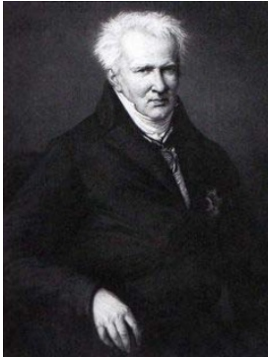
Retrato de Alejandro de Humboldt. Emma Gagiotti-Richards (1854/55)

Venezuela, donde tanto Humboldt como Bonpland, tendrían la oportunidad de estudiar la naturaleza y otras características del país. Esta afortunada visita del sabio alemán fue una suerte para el análisis de un país contenido en esa notable obra 'Viaje a las regiones equinocciales del Nuevo Continente', sólo superada por su obra 'Cosmos', una verdadera enciclopedia científica para su época.