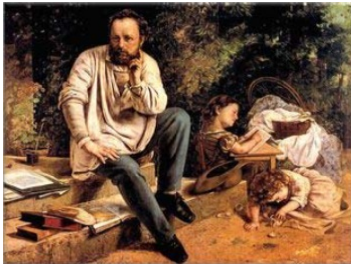
'Pierre-Joseph Proudhon y sus hijos'. Gustave Courbet 1865

"¿Qué es la propiedad?", aparecida en 1840, le hizo repentinamente famoso en París, en Francia y en el mundo. Al año siguiente, en 1841, y luego en 1842, completó las teorías allí expuestas con una Segunda y Tercera memoria. En 1843 escribió dos obras importantes: "La creación del orden en la humanidad" y "El sistema de las contradicciones económicas o la Filosofía de la miseria".