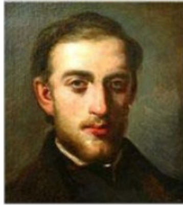
Autoretrato. Fritz Melbye

Nació en Elsinore, Dinamarca, el 24 de agosto de 1826 y falleció en Shanghai, China, el 14 de diciembre de 1896. Pintor de paisajes y de marinas de la escuela danesa. Fue alumno de su hermano Anton, a su vez alumno de la Escuela Pictórica de Dusseldorf y del pintor Eckersberg por quien el paisajismo adquiriría un mayor protagonismo.