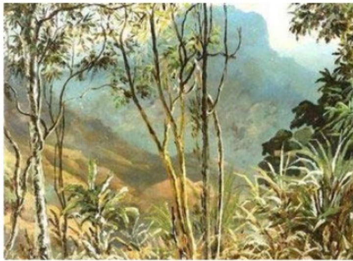
'San Juan de los Morros' 1856. Fritz Melbye