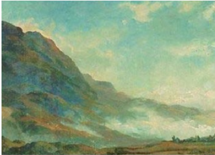
'El Ávila' 1852. Fritz Melbye