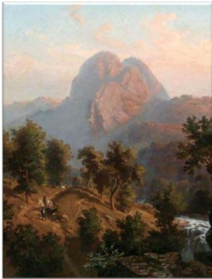
‘Camino de Valencia a Puerto Cabello’. Ferdinand Bellermann

Entre 1842 y 1846, después que las zonas orientales de la Gran Colombia se hubieran separado del Estado soberano de Venezuela, el versátil paisajista prusiano Ferdinand Bellermann recorrió el país como el primero de sus importantes artistas viajero- cronistas. Acompañado por su compatriota el naturalista Kad Moritz, Bellerman se trasladó de Este a Oeste pintando con estilo vigoroso, rico empaste y briosos colores y luz. Pese a que su método de construir composiciones de la sombra a la luz y el Claroscuro, empleando una paleta predominantemente verdosa a marrón, sitúa la obra de Bellerman en la tradición tardía del barroco continental, como dice Alfredo Boulton, ‘el artista captó por primera vez la singularidad del paisaje venezolano, abriendo los ojos autóctonos, acostumbrados a la tranquilidad pastoral, a sus aspectos dinámicos’.