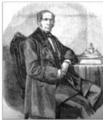
El Barón Jean-Baptiste Louis Gros (1793–1870).

Según Beatriz González (Viaje de Humboldt 200 años" La escuela de Humboldt. Los pintores viajeros y la nueva concepción del paisaje. " Beatriz González Revista Credencial Historia. (Bogotá - Colombia). Febrero 2000. No. 122), cito textualmente: 'En 1838 desembarcó en Venezuela Jean Baptiste Louis, Barón de Gros procedente de Santafé de Bogotá, donde se desempeñaba como Encargado de Negocios del gobierno francés. Más tarde, en 1842 llegó el artista alemán Ferdinand Bellermann becado por el Rey de Prusia para ampliar sus estudios sobre el paisaje tropical. Bellermann permanecería en Venezuela por espacio de algo más de dos años y durante este lapso entablaría una relación tangencial con Adams. 'Ruinas del Convento de Las Mercedes' (1838) es la obra del francés Jean Baptiste Louis, Barón de Gros. Esta pieza nos brinda incidentalmente alguna referencia a los daños ocasionados en Caracas por el violento terremoto de 1812. El interés primario del diplomático Barón de Gros radica en documentar la realidad arquitectónica y topográfica, aunque obviamente ello conlleva la necesidad de incluir el paisaje, rasgo evidente en la detallada vegetación que aparece descrita visualmente en los primeros planos.