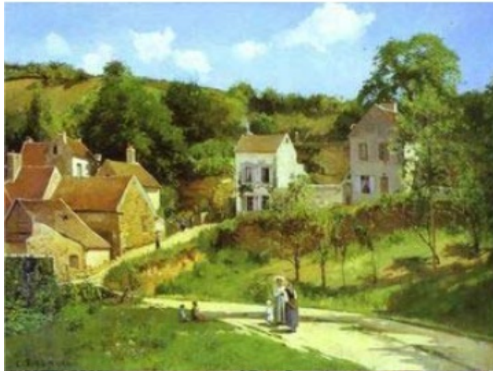
La Ermita en Pontoise, 1867. Camille Pissarro

Vamos a conversar sobre el Pissarro paisajista y con realismo social y con los 'colores nuestros'... nuestro sol, nuestro verde, nuestra intensidad colorística, como lo podemos ver trece años después en una escena pueblerina de Pontoise (ver abajo)