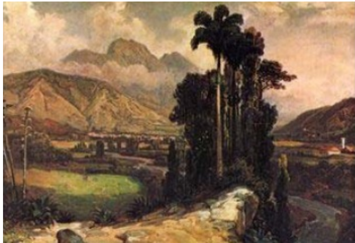
'Valle de Caracas'. Ferdinand Bellermann