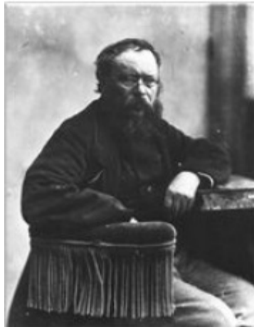
Pierre-Joseph Proudhon (1809-1865)