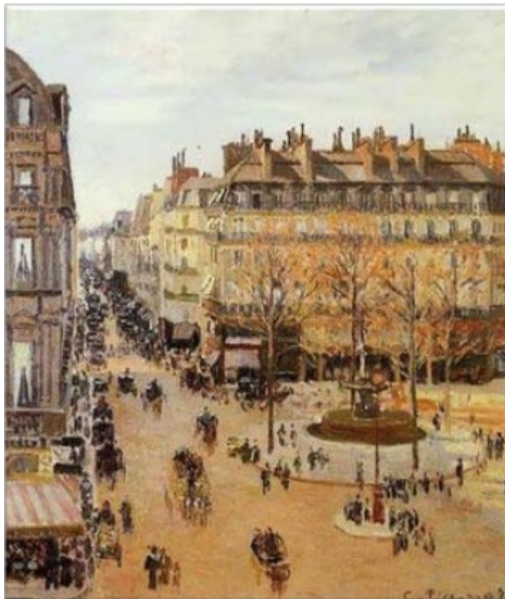
Rué Saint-Honoré después del mediodía. Efecto de lluvia (1897). Camille Pissarro

Las Obras de Camille Pissarro más conocidas e identificadas 'inequívocamente' con él (y que comprenden, curiosamente sólo los últimos 7 años de su vida), no son las que vamos a exponer, son más bien sus obras con tinte social en las que se reflejará su modo de pensar y sus convicciones 'político-sociales' que tienen relación con su permanencia durante 21 meses en Venezuela y su juventud transcurrida en Saint Thomas.