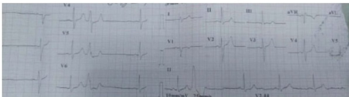
Figura 2 electrocardiograma con transición en V2, V3