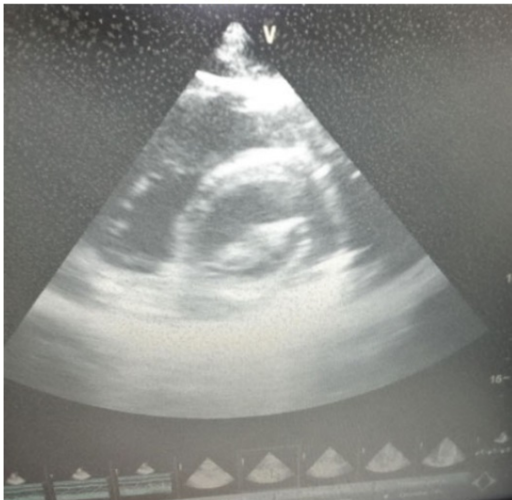
Figura 4 Ecocardiograma trasntorácico eje corto se observa valva mitral anterior y posterior