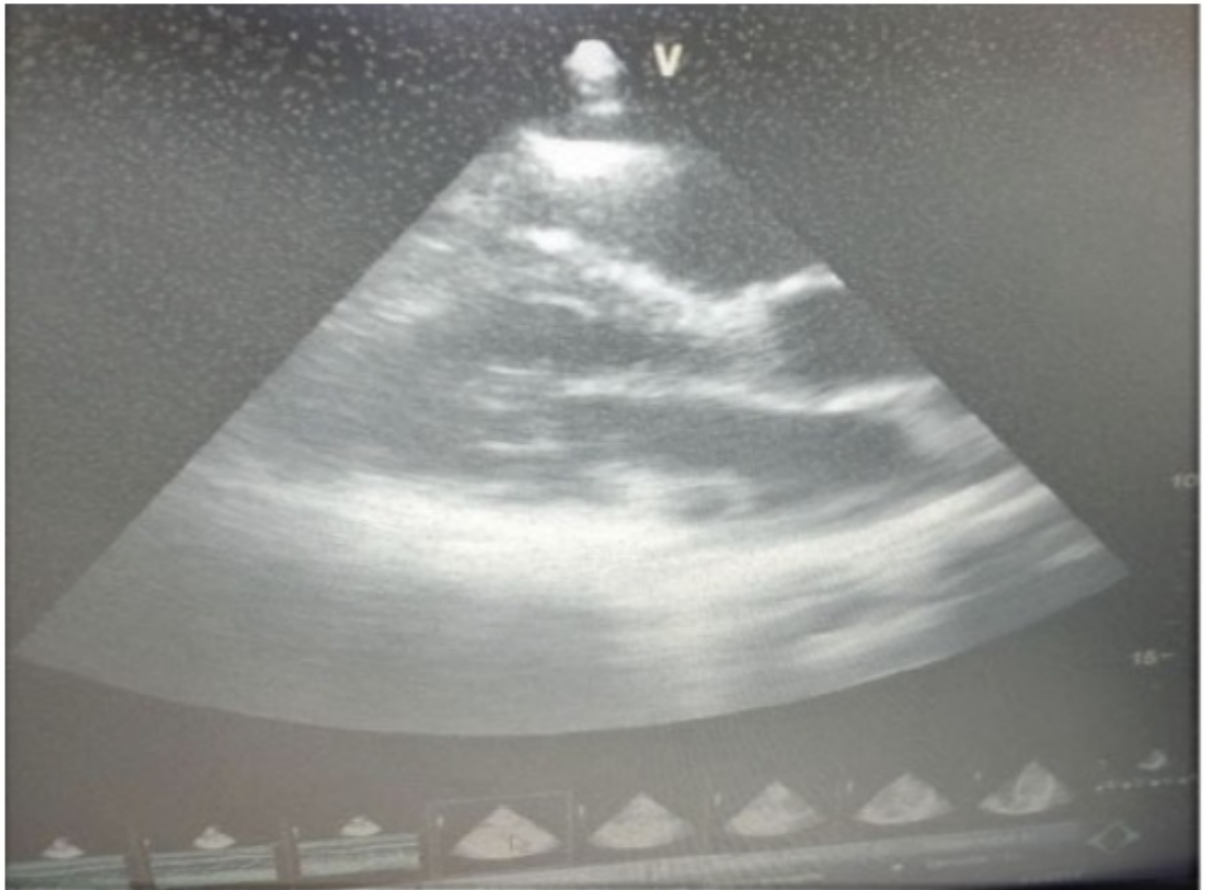
Figura 3. Ecocardiograma trasntorácico eje paraesternal largo se observa implantación de val mitral posterior 6 mm.